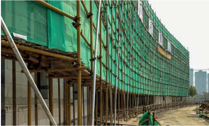
Ảnh (8): © ifb GmbH Hartmut Herrmann